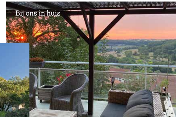
Bij ons in huis