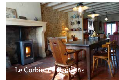
Le Corbier de Sept Ans