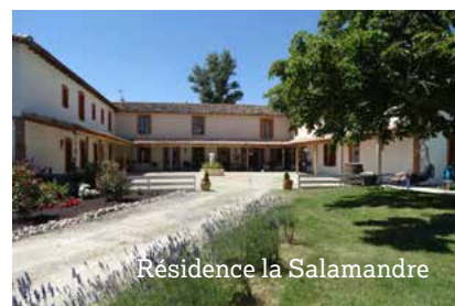
Résidence la Salamandre