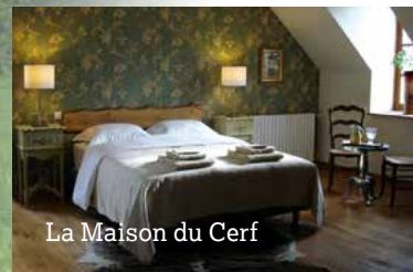
La Maison du Cerf