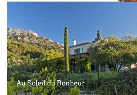
Au Soleil du Bonheur