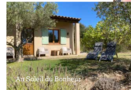
Au Soleil du Bonheur