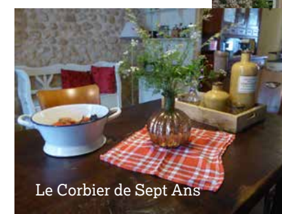
Le Corbier de Sept Ans