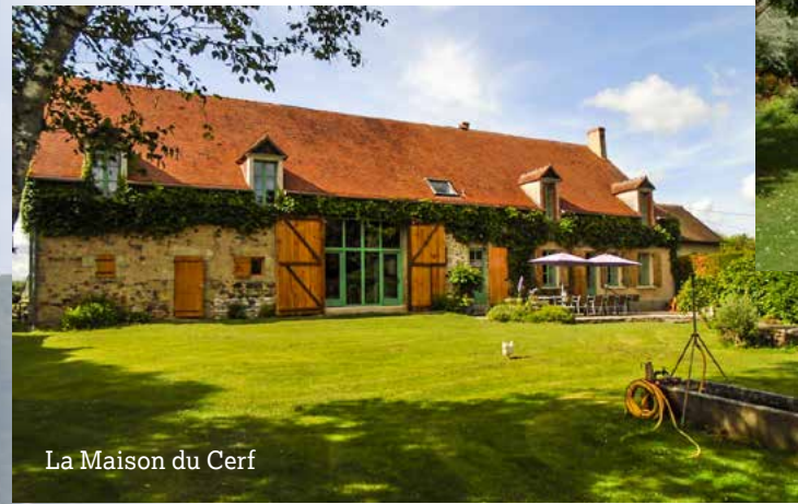
La Maison du Cerf