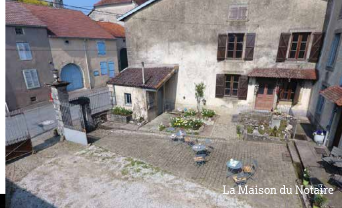
La Maison du Notaire