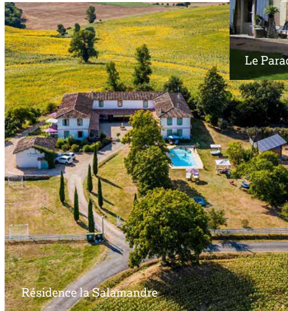
Résidence la Salamandre