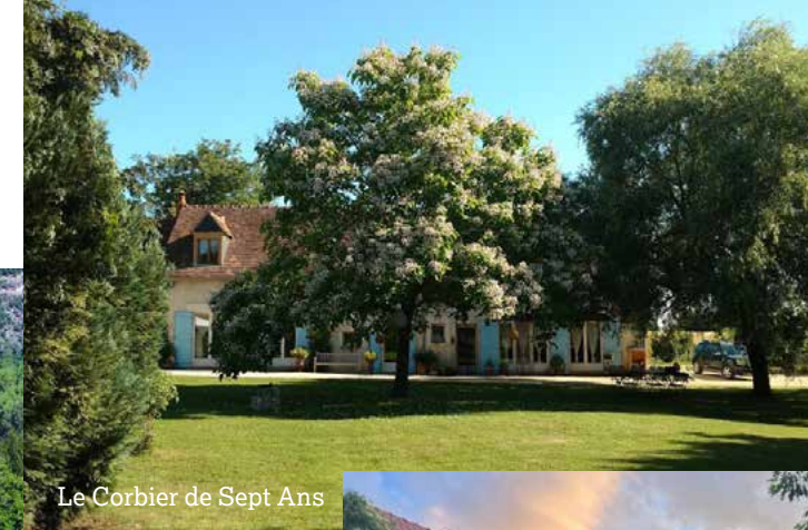
Le Corbier de Sept Ans