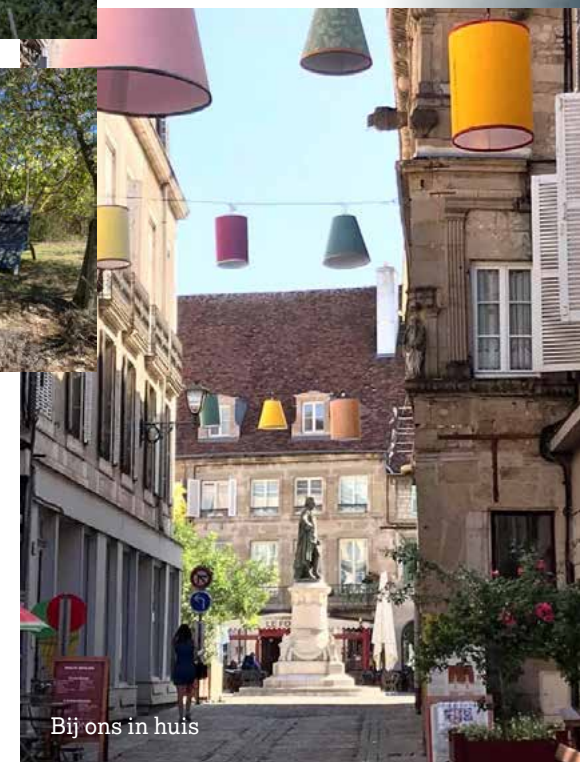
Bij ons in huis