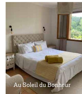
Au Soleil du Bonheur