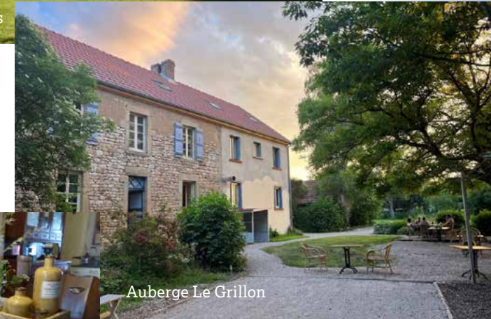
Auberge Le Grillon