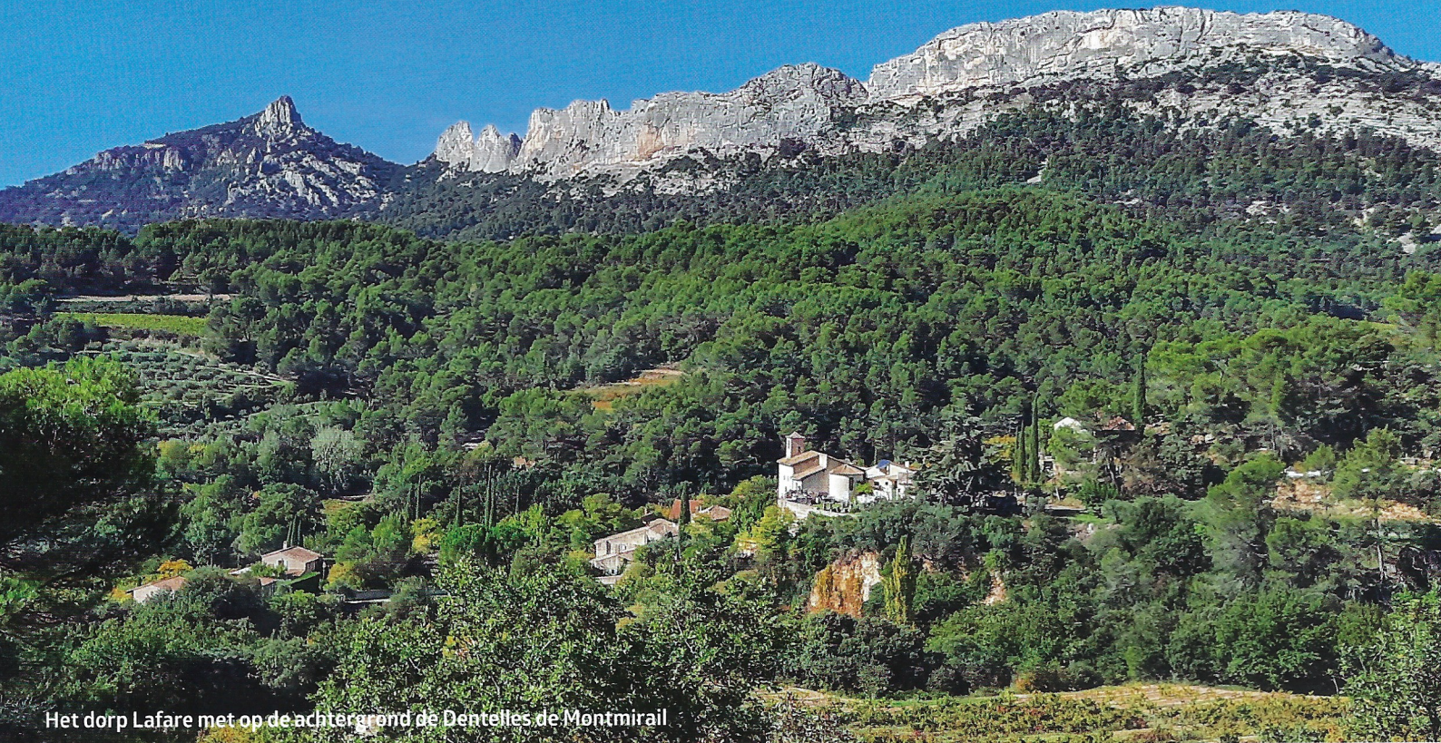
Het dorp Lafare met op de achtergrond de Dentelles de Montmirail